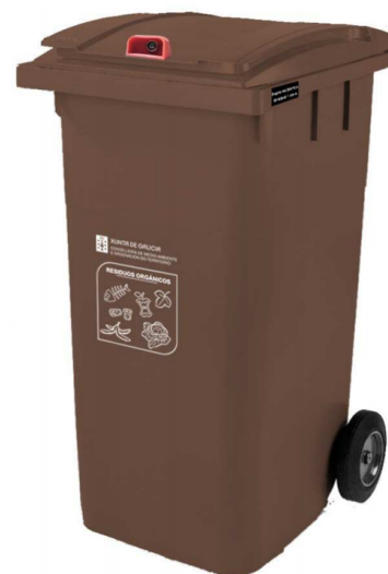
Figura 1. Imaxe do contedor

A fabricación dos contedores é por inxección de PEHD nun molde monocasco que permite fabricar todo o corpo nunha única peza, evitando puntos de fragilidade en unións, e as partes metálicas son de aceiro galvanizado en quente.